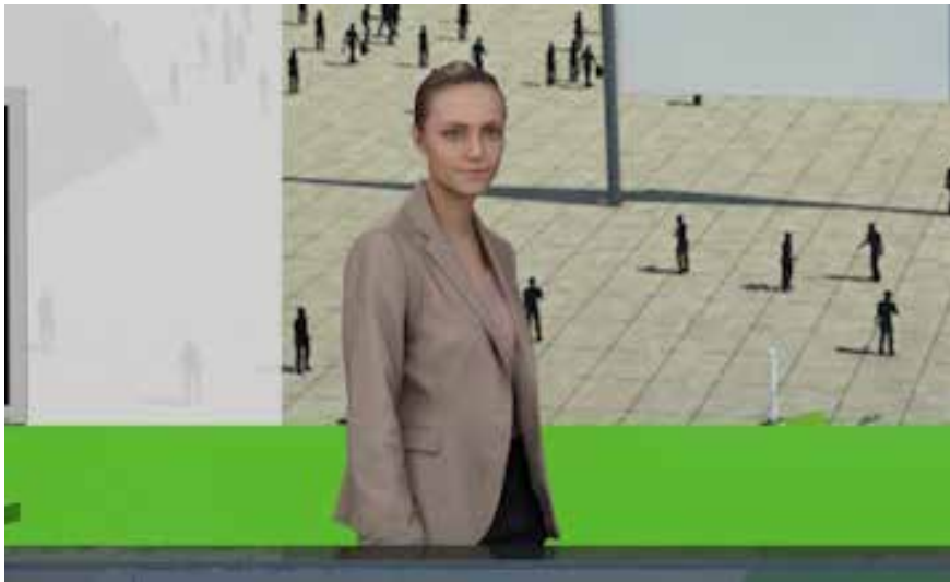
Ihr individueller Avatar